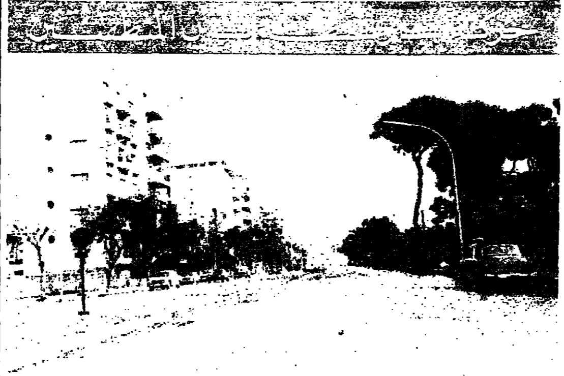
اشتمت حركة السير أمس بين منطقتي بيروت الشرقية والغربية، وعاد الوضع إلى طبيعته بعد حادثة طلمة الكاري.

قال جيرالد بارسي مساعد وزير الخزانة الأمريكية انه يعتقد ان المملكة العربية السعودية تستطيع الالتزام بقراراتها الخاصة بتحديد زيادة اسعار نفطها بنسبة خمسة بالمئة فقط خلال هذه السنة.